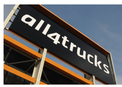
Een nieuwe aanpak voor veilige truckstops in Europa

Er zijn veel te weinig veilige parkeerplaatsen voor vrachtwagens in Europa en de ene is (on)veiliger dan de ander. De EU heeft een certificeringssysteem gelanceerd om dit inzichtelijk te maken en de ADAC heeft recent de belangrijkste 50 truckstops in Europa bezocht. All4Trucks Calais biedt de hoogste veiligheid zowel in het EU certificeringssysteem als in de ADAC test.